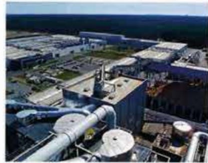
Am integrierten Standort in der Mark Brandenburg entstehen Laminatbodenbeläge in allen Produktionsschritten, von der HDF-Platte bis zur weltweiten Auslieferung