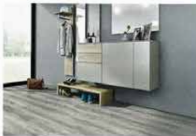
„Eco Vinyl Esche Masterpiece“