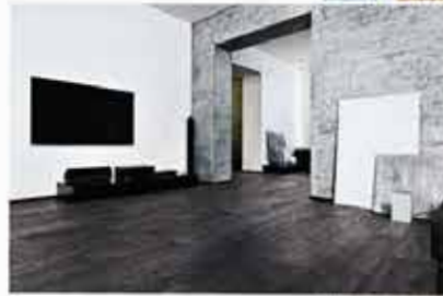
PVC-freier „Greenvinyl“-Bodenbelag „Ulme grau“