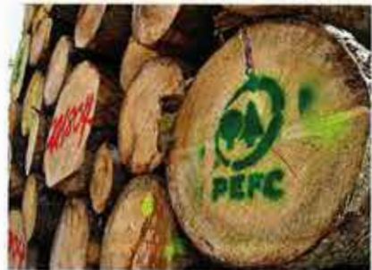
Classen verwendet sowohl PEFC- als auch FSC-zertifizierte Rohstoffe